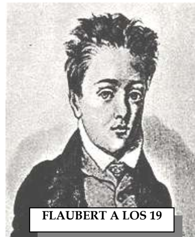
FLAUBERT A LOS 19

Los Bovary estaban arruinados y la culpa era de ella. Necesitaba dinero y no sabia a quien acudir para subsanar sus deudas. Nadie tenia dinero. Como ultimo recurso decidió acercarse a casa de Rodolfo. Al verla se sobresalto. La veía más hermosa que otras veces. Le dijo que le amaba. Ella le pidió dinero a lo que él le contesto que no tenia. Emma salió de allí furiosa.