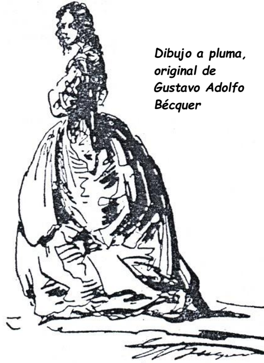
Dibujo a pluma, original de Gustavo Adolfo Bécquer

mientras sentirse puedan en un beso dos almas confundidas; mientras 22 exista una mujer hermosa, ¡habrá poesía!