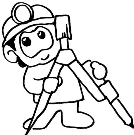
Quita Urpi Madre Luna

¿Qué vienen a ser el amor paloma agreste, tan pequeño y esforzado, desamorado; que al sabio más entendido, palomita agreste, le hace andar desatinado? Desamorada.