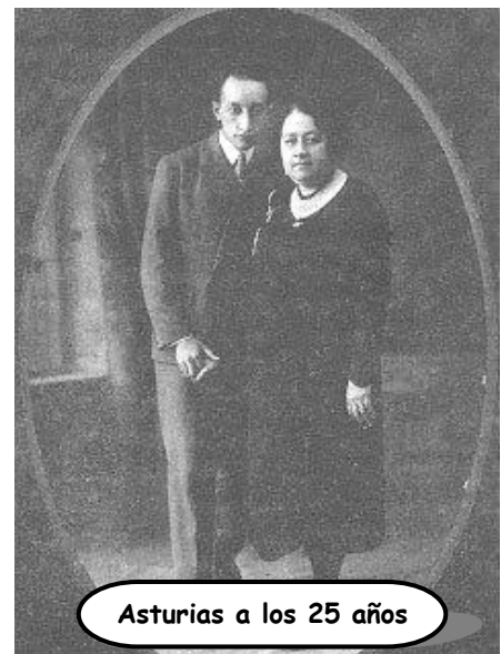
Asturias a los 25 años

Sabías que M.A. Asturias a pesar de haber viajado mucho y conocer muchas culturas otorgaba a Guatemala y a su cultura mítica maya un papel fundamental en su obra.