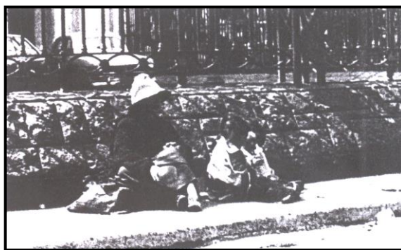
En muchas ocasiones, la situación de los migrantes se torna dramática como la de esta madre y sus dos hijas.

Lima constituye el principal polo de desarrollo del Perú y por lo tanto, la zona más atractiva para la población nacional. Así, se convierte en un poderoso eje absorbente que atrae a miles y miles de compatriotas hacia la capital desarrollándose un Centralismo muy peligroso para el desarrollo nacional.